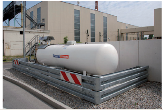
▲ Moderne innerbetriebliche MOTO GAS®-Tankstelle

Die MOTO GAS®-Flasche ist speziell für den Einsatz bei Gabelstaplern konzipiert. Sie hat einen Flaschenkragen, der die Flaschenarmaturen vor Beschädigungen schützt. Sie ist TÜV-geprüft und durchläuft bei Tyczka Totalgaz bei jeder Füllung eine Qualitätssicherung.