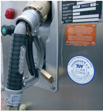
▲ Einfach tanken