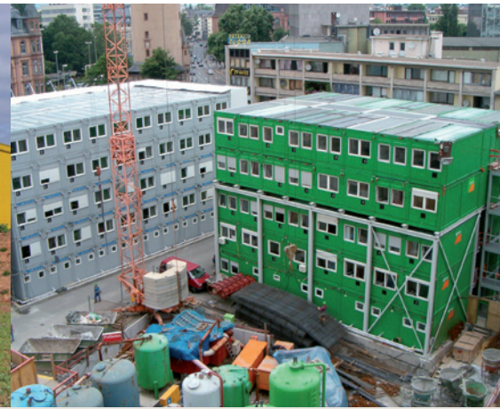
▲ Versorgung einer Containeranlage mit 144 Büro- und Tagesunterkuntscontainern