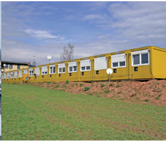
▲ Versorgung einer Containeranlage mit 36 Wohn- und Sanitärcontainern