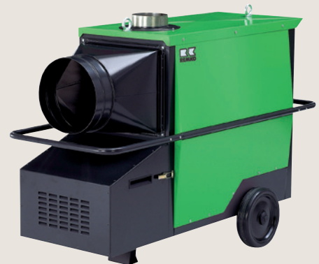
▲ Stationärer, indirekt befeuerter Gaslufterhitzer