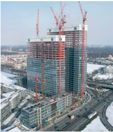
▲ Winterbaubeheizung von zwei Hochhäusern, einem Büro- und einem Hotelkomplex