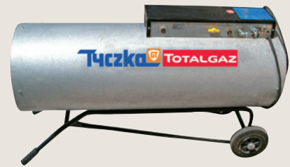
▲ Mobiler, direkt befeuerter Gaslufterhitzer